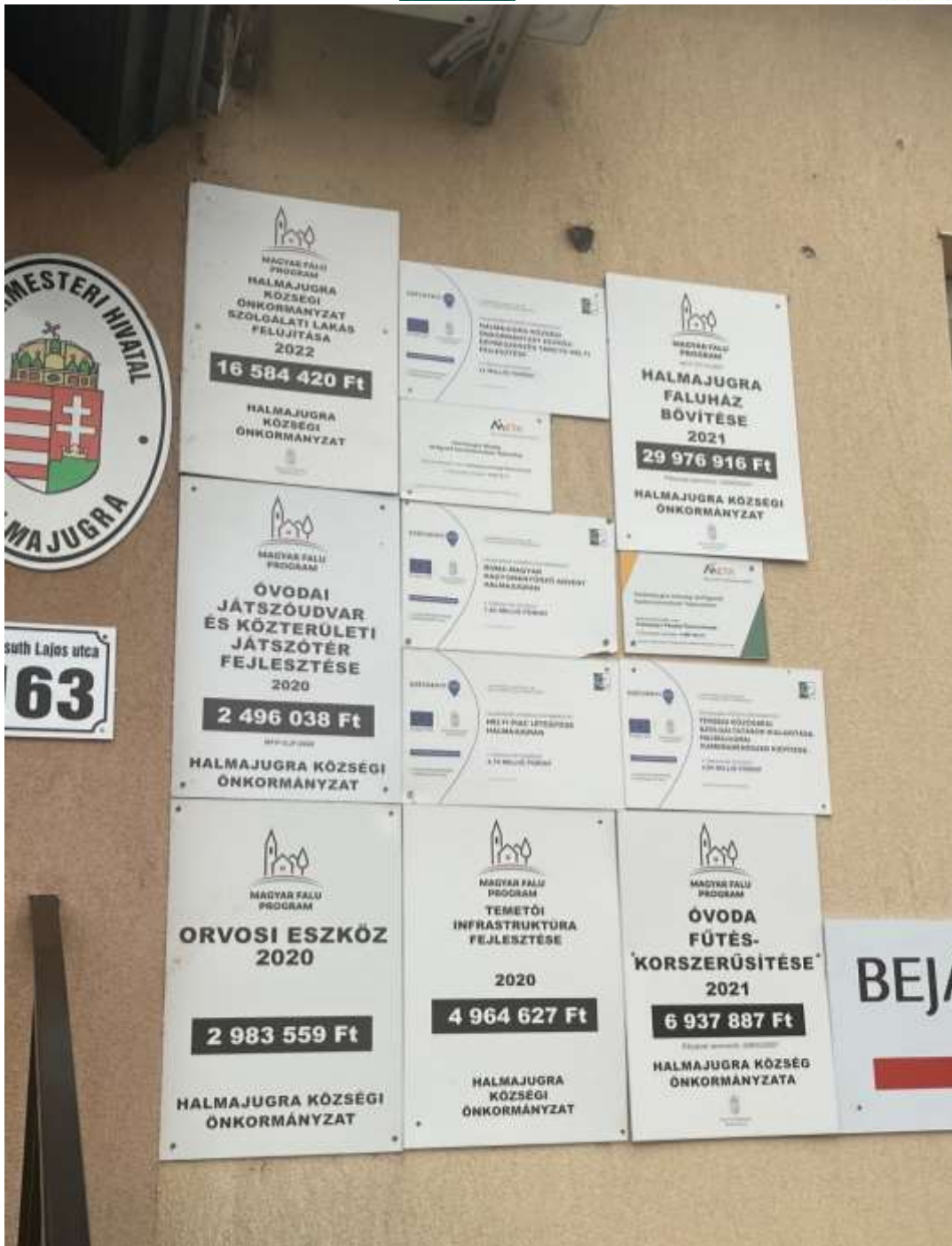
Kelt: Halmajugra, 2025.01.29.